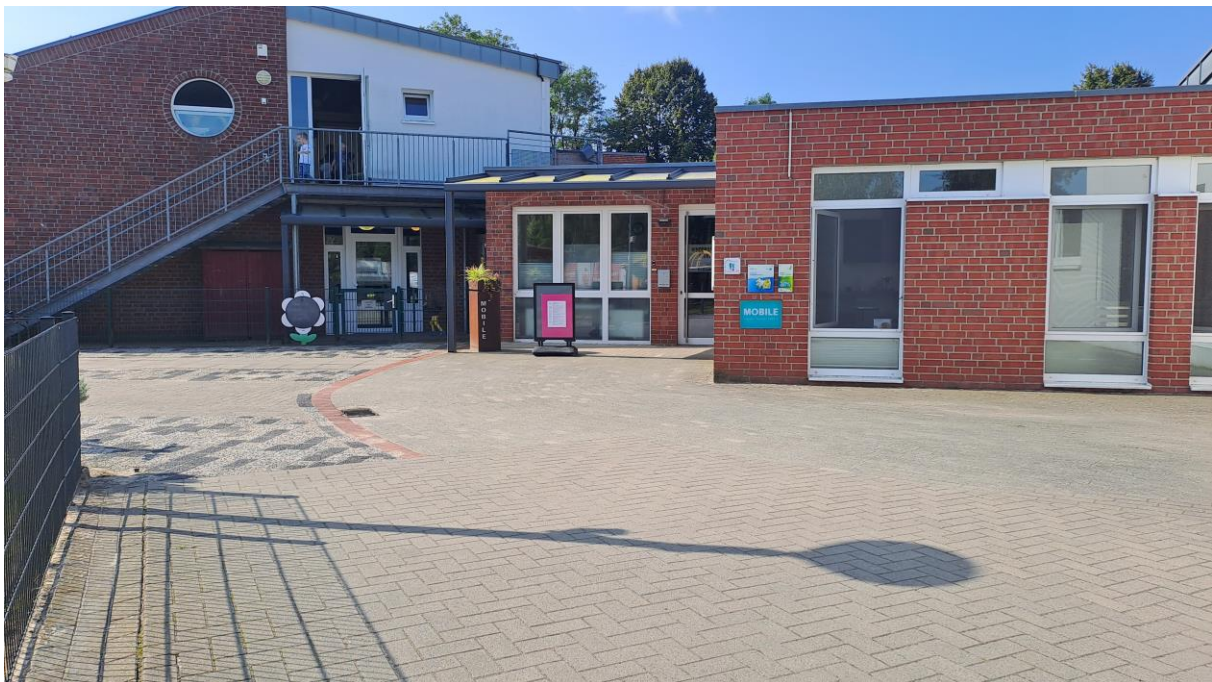
Eingang zum psychomotorischen Bewegungskindergarten Mobile

Bei der Zusammensetzung der pädagogischen Gruppenteams wurde auf eine gute Ergänzung von Fachwissen und persönlichen Qualitäten Wert gelegt. Alle Gruppenleitungen verfügen über die Zusatzqualifikation Psychomotorik oder befinden sich in Ausbildung. Zusätzlich verfügen weitere pädagogische Kräfte über diese Zusatzqualifikation. Außerdem verfügt das Team über eine Feinmotorik-Therapeutin, eine staatlich anerkannte Motopädin, eine Kinder-Krankenschwester und eine Heilpädagogin. Einige Kolleg*innen bilden sich zu einer Fachkraft eines bestimmten Bereichs fort. (Fachkraft für Inklusion, Sprache, U3, Elternberatung, etc.) Die Teammitglieder haben die Möglichkeit mind. 1-mal jährlich eine Fortbildung zu besuchen. Zudem nimmt jedes Team jährlich an einer Teamfortbildung teil.